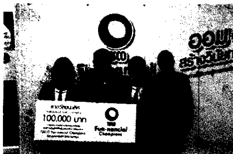
ทีมชนะเลิศการประกวดผลิตภัณฑ์กิจกรรมต่อยอด รุ่นที่ 4 โรงเรียนหาดใหญ่วิทยาลัย จ.สงขลา