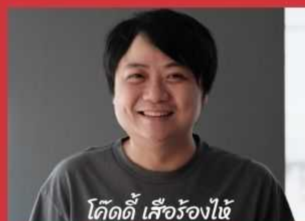
ไค้ดดี เสือร้องไห้

ตัวแทนศิษย์เก่าวิทยาลัยนวัตกรรมสังคมรุ่นใหม่ ที่เคยทำงานด้านจิตอาสา มุมมองการทำงานเพื่อสังคม และแนวคิดในการพัฒนาสังคมในการเป็นผู้นำจิตอาสารุ่นใหม่