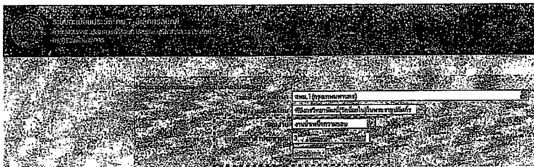
รูปที่ 15 แสดงการลงทะเบียนรับรหัสผ่าน